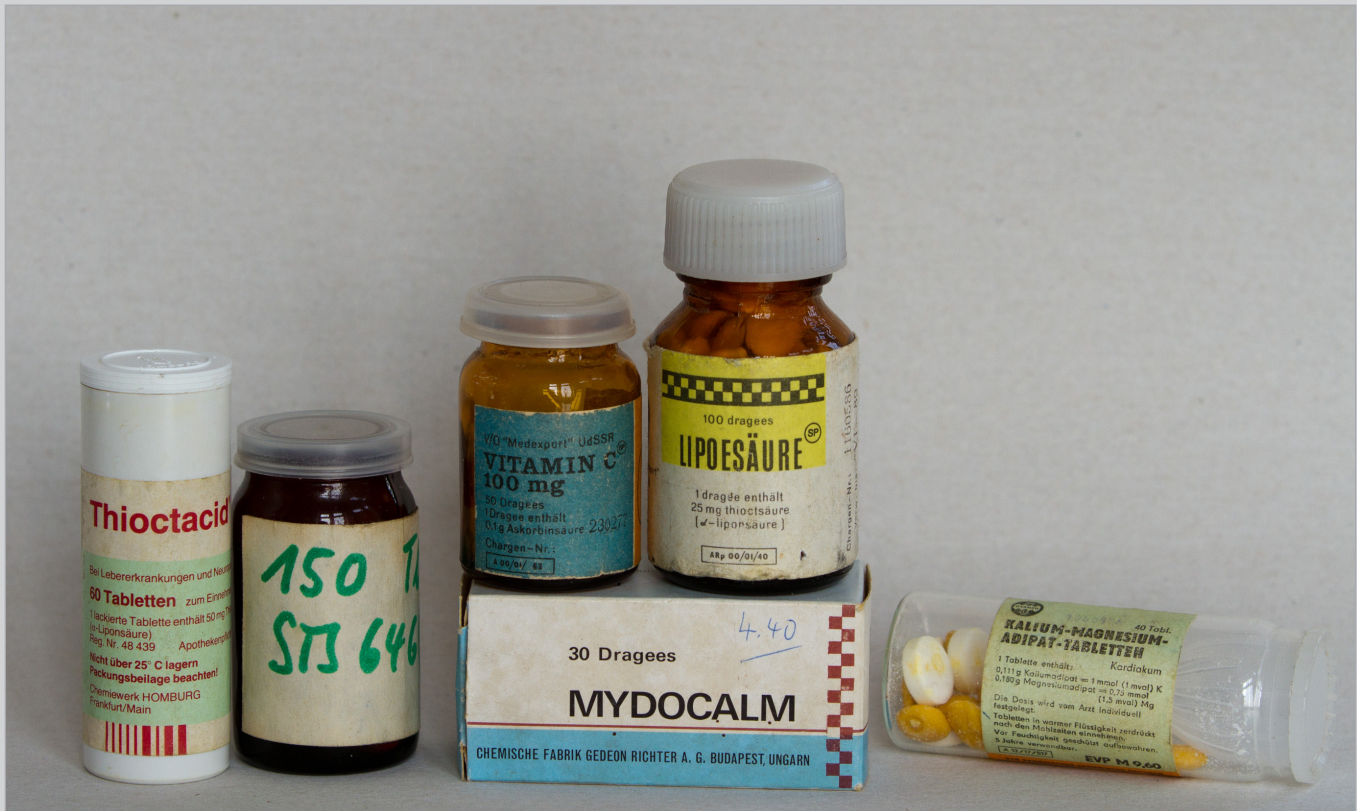
Präparate aus den Jahren 1987/1988, die ein 800-Meter-Läufer von seinem Sportarzt bekam, darunter die anabolen Steroide Oral-Turinabol und STS 646.